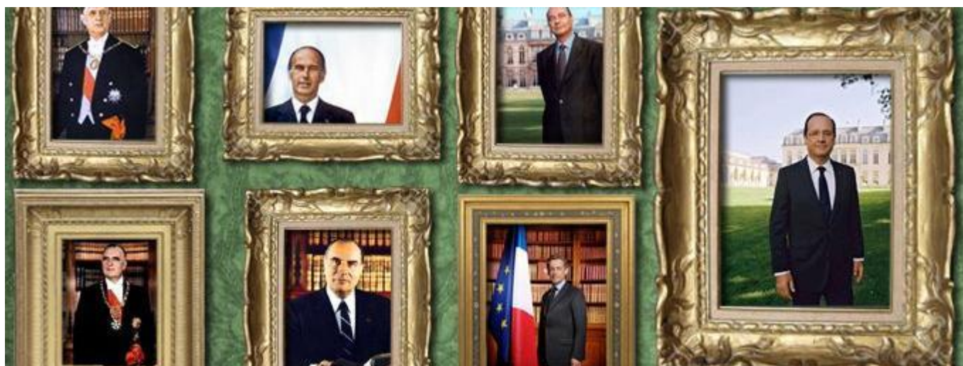
Les portraits officiels des présidents de la Vème République (Laurence Houot-Remy)

Une représentation personnelle du pouvoir !