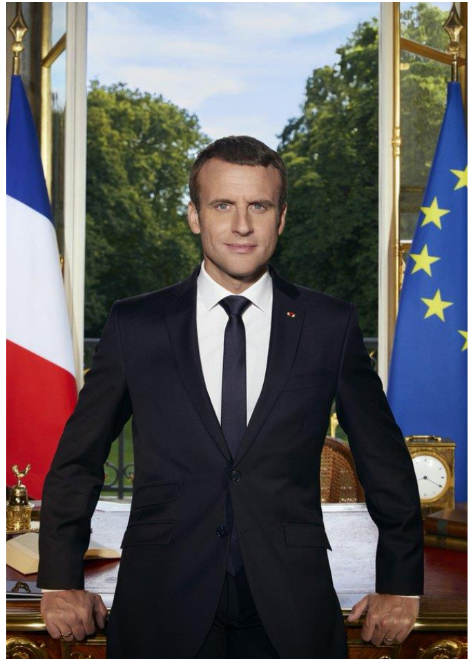
Portrait officiel du Président de la République , M. Emmanuel Macron, par Soazig de La Moissonnière (2017)