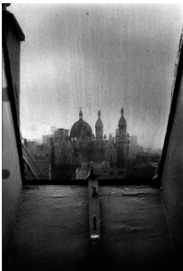
Keiichi Tahara , Série Fenêtre , photographie (1980)